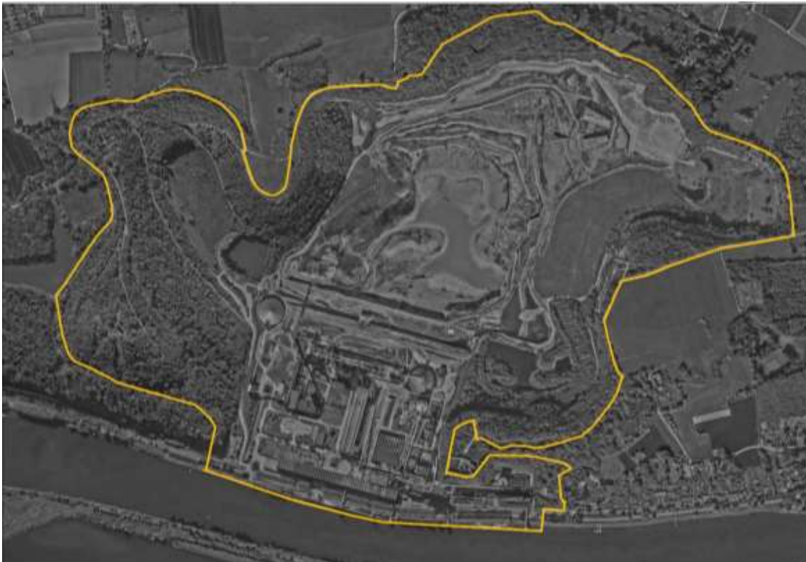
Afbeelding: luchtfoto 2024 ENCI-plangebied

Specifiek voor het ENCI-gebied werd een Plan van Transformatie (PvT) opgesteld in 2010. In dit kader werkt de gemeente Maastricht samen met een aantal partijen: provincie Limburg, eigenaar bedrijventerrein Limburg Real Estate (LRE), Natuurmonumenten en bewonersgroep Sint-Pietersberg Adembenemend (SPA). Het Plan van Transformatie werd geactualiseerd in 2021. Privaatrechtelijk zijn in februari 2023 afspraken opnieuw vastgelegd in een Wijzigingsovereenkomst.